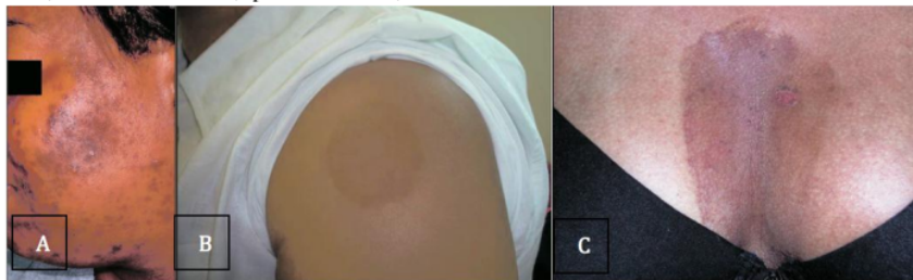
Gambar 2. Manifestasi HPI. A. HPI sekunder dari akne vulgaris. B. HPI sekunder dari dermatosis inflamasi, tinea korporis. C. Pasien yang mengalami HPI setelah melakukan chemical peeling di dada. 1

Langkah awal yang paling penting untuk diagnosis dan merencanakan rejimen pengobatan adalah melakukan anamnesis secara menyeluruh. Apabila penyebab teridentifikasi secara jelas dan kemudian dijelaskan kepada pasien, maka diharapkan kepatuhan pasien terhadap terapi akan meningkat. Ketika didapatkan bercak atau makula hiperpigmentasi di sekitar adanya inflamasi, maka diagnosis HPI dapat ditegakkan. Pemeriksaan tambahan kadang diperlukan apabila faktor pencetus HPI berhubungan dengan fitodermatitis dari buah atau pewangi, fixed drug eruption, atau pengobatan dingin, atau panas, atau susah untuk diidentifikasi. Hal yang menarik yaitu HPI dapat menjadi petunjuk untuk diagnosis morfea ketika tidak ada eritema, namun hiperpigmentasi berhubungan dengan atrofi kulit. Pemeriksaan klinis dimulai dengan menentukan batas, uniformitas, kedalaman pigmentasi, difasilitasi dengan penggunaan dermatoskopi, atau lampu Wood. Pemeriksaan lampu Wood menunjukkan lesi epidermal memiliki batas tegas, sedangkan lesi dermal kurang tegas. Lesi campuran yang memiliki kedua lesi pigmentasi epidermal dan dermal menunjukkan batas tegas pada sebagian lesi. 9