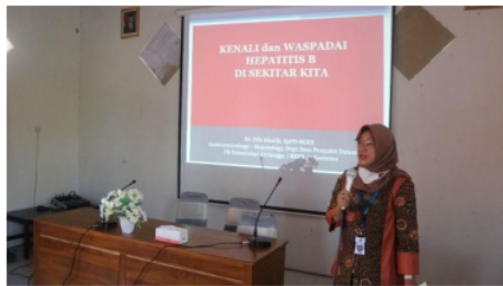
Gambar 3. Seminar strategi tangguh terhadap penyakit menular

Kegiatan ketiga, tenaga kesehatan Desa Kare Kecamatan Kare Kabupaten Madiun mengikuti serangkaian pelatihan. Pelatihan dengan topik ‘Kenali dan Waspada Hepatitis B di Sekitar Kita’ yang diikuti oleh lebih dari 20 orang tenaga kesehatan, staf Desa Kare, serta ibu-ibu pemilik usaha khas desa Kare, yang terlihat pada Gambar 3. Sebagai desa pariwisata pelatihan ini diperlukan karena destinasi atau sasaran warga yang cukup banyak. Selain itu, Universitas Airlangga sebagai kampus life sciences concern terhadap kesehatan masyarakat, khususnya terkait hepatitis B.