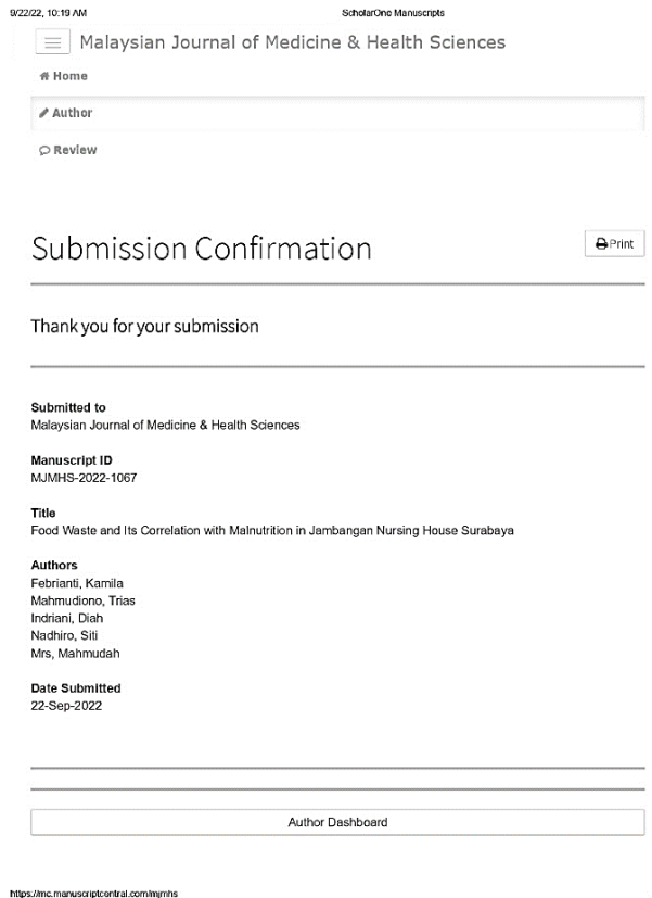
Gambar 1. Submit manuskrip pada Malaysian Journal of Medicine & Health Sciences