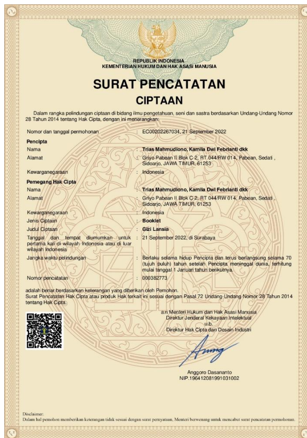
Gambar 4. Sertifikat HAKI Leaflet Gizi Lansia