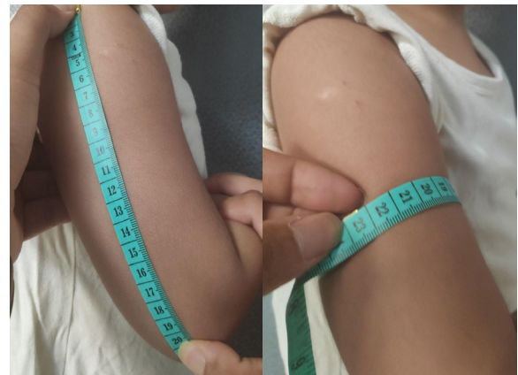
Gambar 1 Pengukuran Panjang Lengan dan Lingkar Lengan Atas Tengah

regresi linear dengan mengukur tingkat akurasi hasil perkiraan suatu model. Bila hasilnya semakin mendekati nol maka tingkat akurasi semakin baik dan pada penelitian ini didapatkan hasil RSME 2,06. Kemudian, dilakukan uji dengan toleransi berat badan 10% dari berat badan aktual, Mercy method mampu memprediksi dengan benar dalam batas toleransi berat badan pada 76,5% dari populasi dan bila toleransi dinaikkan hingga 20%, metode ini mampu memprediksi dengan benar berat badan hampir seluruh populasi penelitian (97,3%). Setelah dilakukan olah data dengan membagi populasi berdasar atas kategori jenis kelamin, kelompok usia, dan status gizi didapatkan hasil yang bervariasi dengan koefisien regresi 0,784–0,931 (Tabel 4). Pada subgrup jenis kelamin laki-laki dan perempuan didapatkan hasil yang hampir serupa dengan nilai koefisien regresi 0,919 dibanding 0,927 serta uji bias dan presisi yang