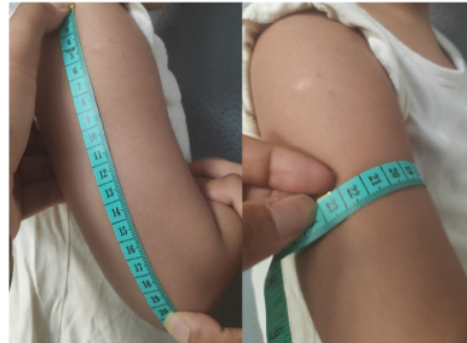
Gambar 1 Pengukuran Panjang Lengan dan Lingkar Lengan Atas Tengah

2 regresi linear dengan mengukur tingkat akurasi hasil perkiraan suatu model. Bila hasilnya semakin mendekati nol maka tingkat akurasi semakin baik dan pada penelitian ini didapatkan hasil RSME 2,06. Kemudian, dilakukan uji dengan toleransi berat badan 10% dari berat badan aktual, Mercy method mampu memprediksi dengan benar dalam batas toleransi berat badan pada 76,5% dari populasi dan bila toleransi dinaikkan hingga 20%, metode ini mampu memprediksi dengan benar berat badan hampir seluruh populasi penelitian (97,3%). Setelah dilakukan olah data dengan membagi populasi berdasar atas kategori jenis kelamin, kelompok usia, dan status gizi didapatkan hasil yang bervariasi dengan koefisien regresi 0,784-0,931 (Tabel 4). Pada subgrup jenis kelamin laki-laki dan perempuan didapatkan hasil yang hampir serupa dengan nilai koefisien regresi 0,919 dibanding 0,927 serta uji bias dan presisi yang