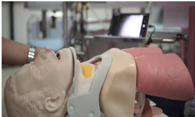
Gambar 2. Maneken imobilisasi cervical Spine dengan rigid collar neck