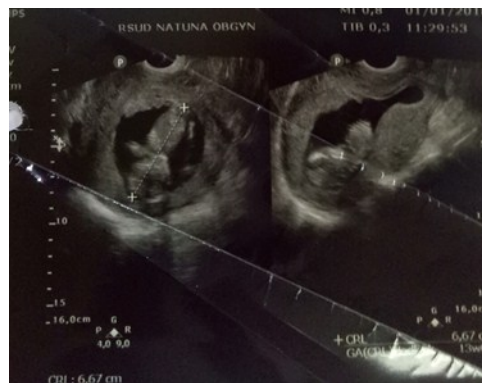
Gambar 1. USG fetomaternal perawatan hari pertama didapatkan janin tunggal intrauterin sesuai masa kehamilan 13 minggu.

minggu dengan portio terbuka. Setelah dilakukan intubasi di ICU, dilakukan juga pemeriksaan Rontgen dada (Gambar 2A) dan didapatkan gambaran perselubungan radioopak disertai reticulogranular pattern di kedua lapang paru, menyimpulkan suatu gambaran interstitial pneumonia. Dari hasil anamnesis, pemeriksaan fisik dan pemeriksaan penunjang, pasien didiagnosis dengan acute respiratory failure due to pneumonia tuberculosis with differential diagnosis SLE+abortus incomplete (G3P2A0 UK 12-13 minggu). Pasien kemudian dirawat di ICU selama 21 hari hingga mengalami perburukan kondisi dan meninggal pada hari perawatan ke 22.