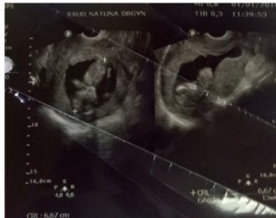
Gambar 1. USG fetomaternal perawatan hari pertama didapatkan janin tunggal intrauterin sesuai masa kehamilan 13 minggu.

minggu dengan portio terbuka. Setelah dilakukan intubasi di ICU, dilakukan juga pemeriksaan Rontgen dada (Gambar 2A) dan didapatkan gambaran perselubungan radioopak disertai reticulogranular pattern di kedua lapang paru, menyimpulkan suatu gambaran interstitial pneumonia. Dari hasil anamnesis, pemeriksaan fisik dan pemeriksaan penunjang, pasien didiagnosis dengan acute respiratory failure due to pneumonia tuberculosis with differential diagnosis SLE+abortus incomplete (G3P2A0 UK 12-13 minggu). Pasien kemudian dirawat di ICU selama 21 hari hingga mengalami perburukan kondisi dan meninggal pada hari perawatan ke 22.