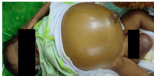
Gambar 1. Anak dengan atresia bilier

Jika atresia bilier tidak didiagnosis atau didiagnosis terlambat, beberapa komplikasi serius dapat terjadi. Beberapa komplikasi yang mungkin timbul akibat keterlambatan dalam mendiagnosis atresia bilier antara lain: (1) Kerusakan hati: Kerusakan hati semakin parah jika atresia bilier tidak diobati. Hati