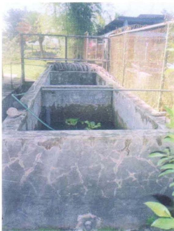
Gambar 5. Kolam berudu