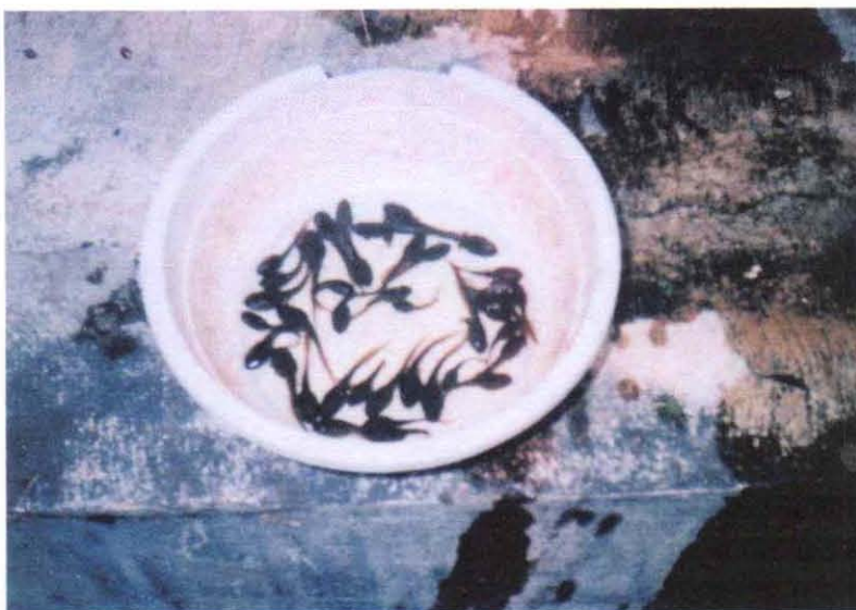
Gambar 1. Berudu

Menurut Muharyanto (1988), kedalaman air dalam bak penetasan antara 0,25 - 0,30 m. Air harus mengalir secara terus menerus. Bak ditutup dengan kawat kasa atau jaring untuk mencegah masuknya hama. Telur menetas 2 - 3 hari pada suhu air antara 24 0 C - 30 0 C. Tingkat kematian atau mortalitas antara 20 - 40%. Setelah menetas sampai dengan dua minggu larva tidak diberi makan sampai akhirnya dipindahkan ke kolam perawatan berudu tersendiri.