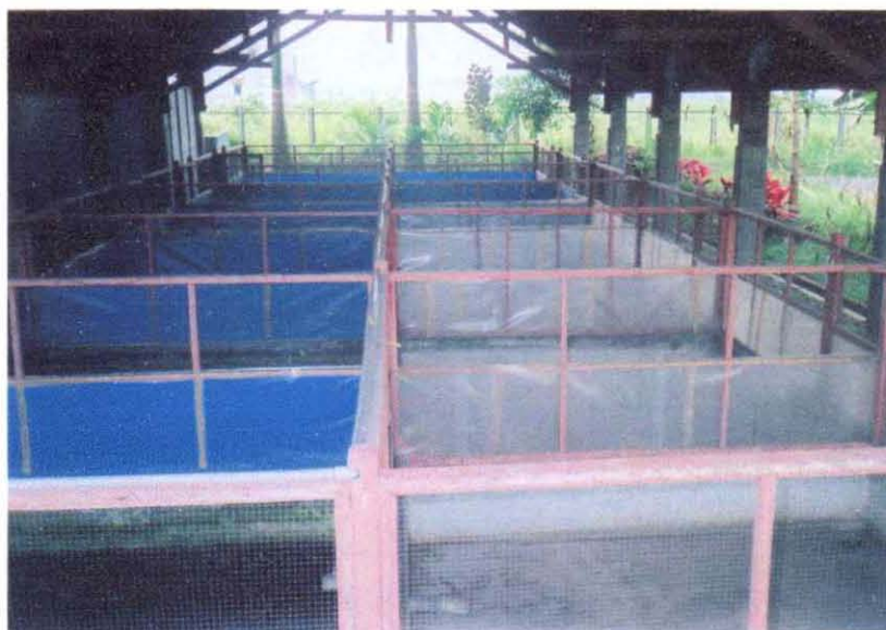
Gambar 8. Kolam katak ukuran konsumsi

kedua ini mempunyai ukuran panjangnya 3 m, lebarnya 2,5 m dan tinggi pagar yang terbuat dari semen kurang dari 0,5 m, tinggi kawat kasanya pun hanya 1 m, tidak sampai mencapai atap gentengnya. Padat penebaran untuk katak yang berukuran 200 gram/ekor adalah 20 - 25 ekor/m 2 .