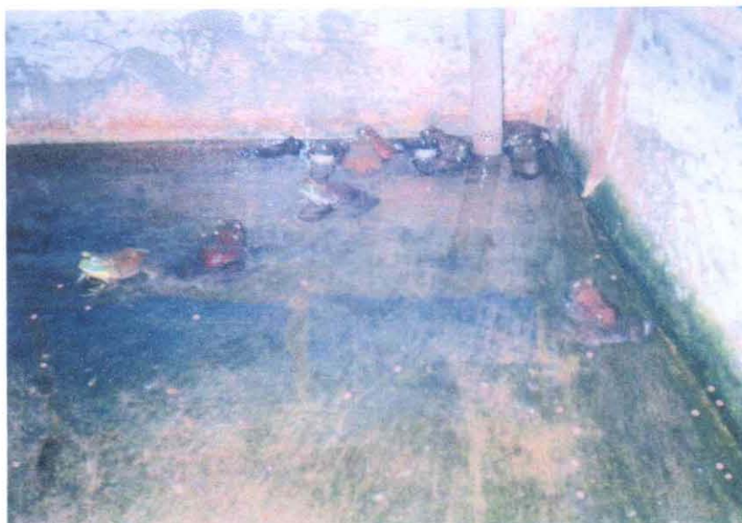
Gambar 7. Katak ukuran konsumsi

m dan tingginya 1 m. Sebanyak dua buah. Sedangkan untuk kandang pembesaran adalah tempat yang digunakan untuk memelihara percil sampai mencapai ukuran konsumsi atau calon induk. Pada pembesaran bullfrog menggunakan sistem kandang tertutup.