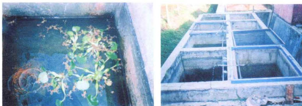
Gambar 6. Percil dan kolam percil

yang dibutuhkan adalah 2 - 3 bulan. Percil pada umumnya menyukai makanan hidup seperti serangga, belatung, dan sejenisnya. Namun untuk memenuhi kebutuhan makanan percil perlu juga ditambahkan makanan lain dengan kadar protein 30%. Makanan tambahan ini berupa pelet terapung sebanyak 3% biomas per hari dengan frekuensi pemberian pakan 3 - 5 kali per hari. Selain pelet percil juga diberi makanan tambahan berupa cincangan daging bekicot. Untuk membuat makanan seolah-olah hidup maka perlu adanya aliran air kecil untuk menggerakkan makanan tersebut.