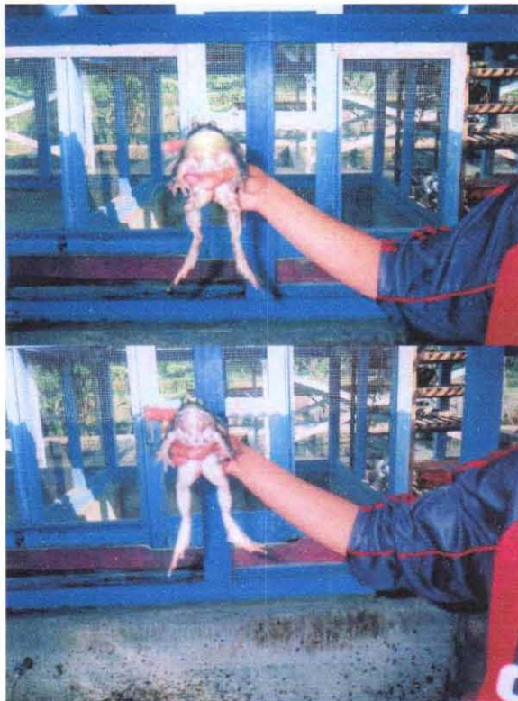
Gambar 4. Katak jantan dan betina