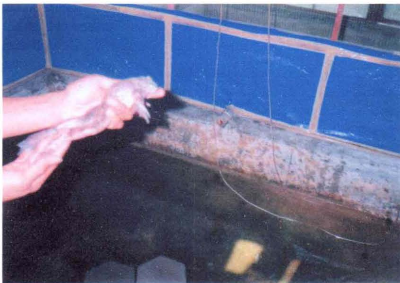
Gambar 9. Penyakit kaki merah

Penyakit ini sering menyerang percil dan katak dewasa. Penyebab penyakit ini adalah bakteri Aeromonas sp. dan biasanya banyak terdapat pada air kolam yang kotor. Tanda-tanda penyakit adalah adanya bercak merah pada paha dan badannya. Penyakit ini menular dan dapat menyerang system syaraf sehingga katak yang terkena akan mati. Usaha yang dilakukan terhadap penyakit ini adalah mencegah dengan membersihkan kolam dan memberi makan katak yang cukup kalori. Usaha pengobatan belum dilakukan. Apabila ada katak yang terserang penyakit ini, maka katak tersebut diambil dan dipindahkan ke kolam karantina. Karena tidak ada penanganan maka katak tersebut akan mati.