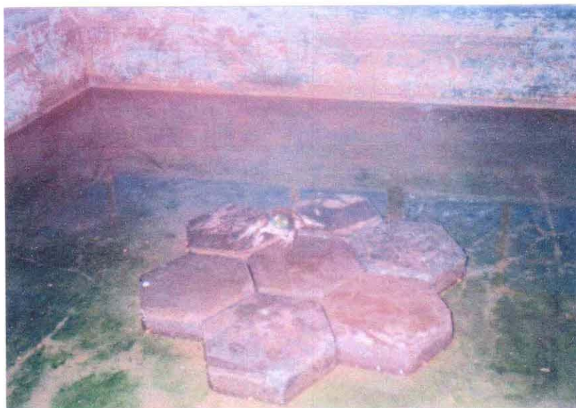
Gambar 10. Penyakit ayan

Sedangkan untuk penyakit kembang menurut Usni (1999), sampai saat ini belum ditemukan obatnya. Untuk mengatasi penyakit ini adalah dengan memuasakan bullfrog-bullfrog yang terserang atau memisahkan dengan bullfrog yang sakit. Penyebab penyakit ayan diduga karena sinar matahari terlalu banyak masuk ke dalam kandang. Penyakit ini belum diketemukan obatnya. Sebagai upaya pencegahannya dapat dilakukan dengan memisahkan bullfrog yang sudah terserang karena dikhawatirkan dapat menyerang bullfrog yang masih sehat (Usni, 1999).