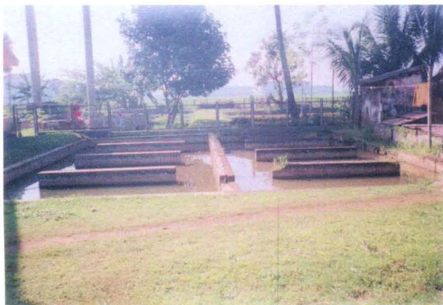
Gambar 3. Bak pengendapan

Kualitas air ini menunjukkan kisaran yang baik bagi kehidupan organisme dalam air, terutama di sini adalah berudu. Suhu air berpengaruh terhadap lama tidaknya telur menetas, pada kisaran suhu 24 - 30^{\circ}\text{C} telur akan menetas 2 - 3 hari. Pendapat ini hampir sama dengan pendapat Chen T. P. (1976), bahwa pada suhu 24 - 27^{\circ}\text{C} telur akan menetas selama 72 jam.