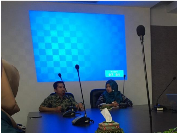
Gambar 1. Orientasi Pengenalan BAPPEKO