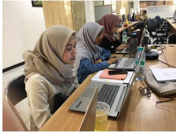
Gambar 2. Mengerjakan Laporan Magang di BAPPEKO