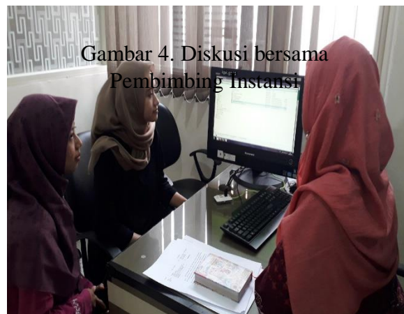
Gambar 4. Diskusi bersama Pembimbing Instansi