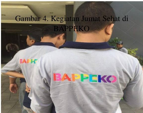
Gambar 4. Kegiatan Jumat Sehat di BAPPEKO