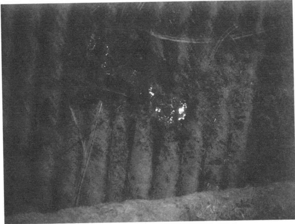
Gambar 3. Feses sapi yang terserang diare