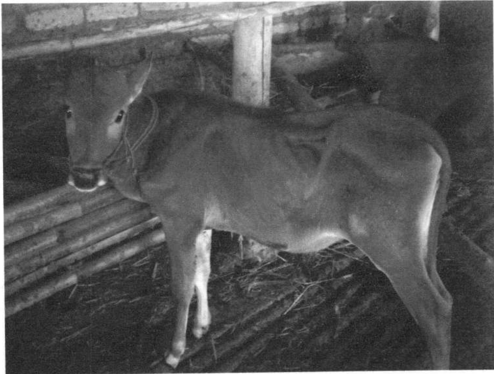
Gambar 1. Pedet yang mengalami diare