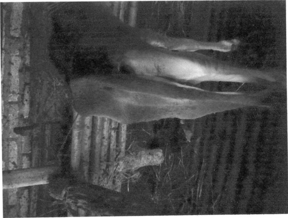
Gambar 2. Pedet yang terserang diare terlihat dari belakang