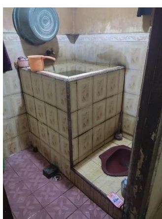
Kamar mandi yang dilengkapi jamban