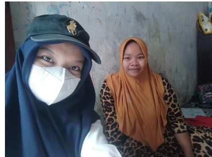
Survei Rumah Sehat