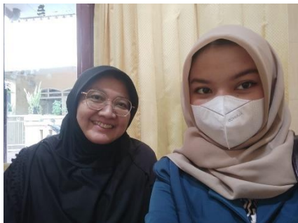
Foto bersama kader