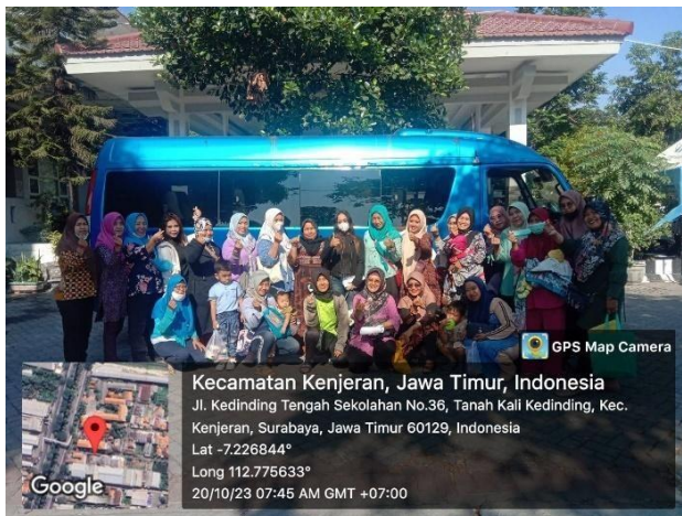
Calon Akseptor Pelayanan KB