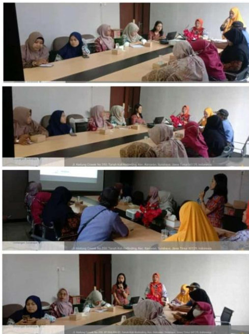
Mini Loka Karya Kecamatan Kenjeran