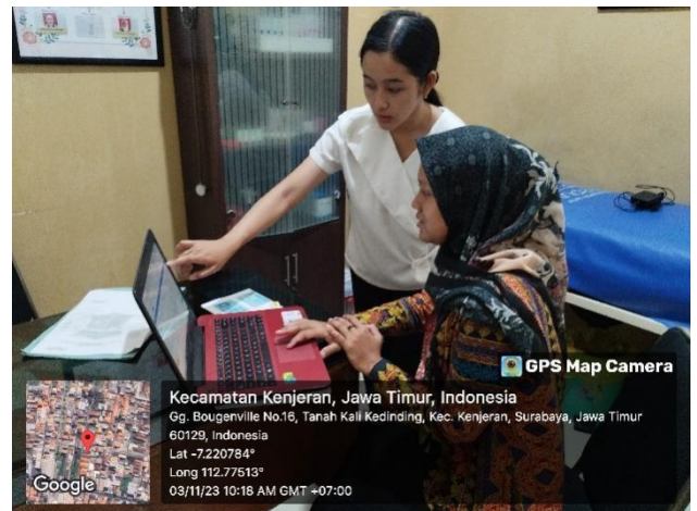
Pendampingan Kunjungan Faskes PBM