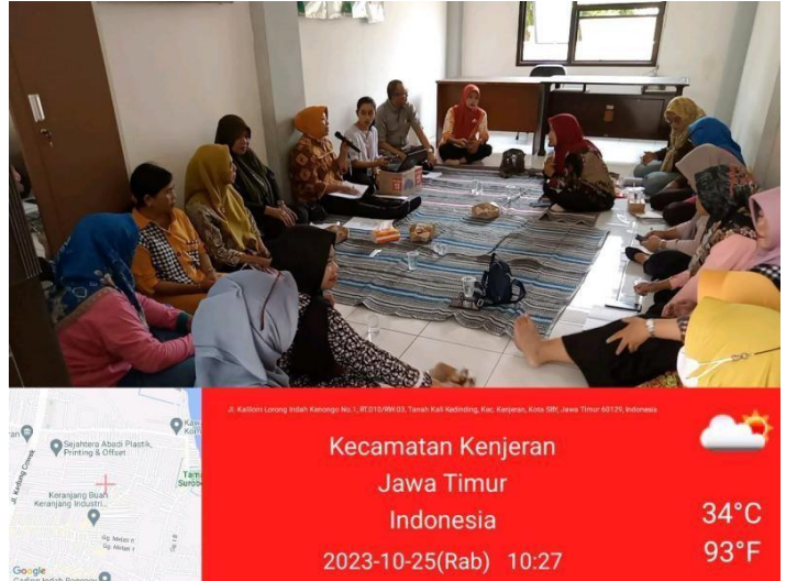
Pertemuan Pengurus Kampung KB Kelurahan Tanah Kali Kedinding