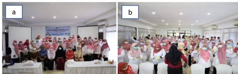
Gambar 2. Foto bersama peserta dengan narasumber, panitia, dan perwakilan Dinas Kesehatan Kabupaten Bangkalan; dan 2b. Praktek hand hygiene sesuai WHO.

Media pembelajaran yang digunakan dalam pelaksanaan kegiatan pengabdian masyarakat ini berupa power point presentation , modul materi, peralatan berupa sarung tangan lateks ( gloves ), handsrub berbasis alkohol 70%, dan pewarna Giemsa. Pewarna Giemsa ini digunakan untuk membantu dan memantau apakah 6 langkah Gerakan Cuci Tangan ( hand hygiene ) yang didemonstrasikan dan dipraktikkan oleh peserta di masing-masing kelompok sudah benar atau tidak.