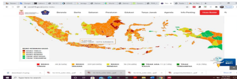
Gambar 1. Peta Zonasi Resiko COVID-19. Wilayah Surabaya dan sekitarnya menunjukkan resiko kenaikan kasus sedang

yang dihimpun oleh Badan PPSDMK Kemenkes RI menunjukkan bahwa hingga 11 September 2020, sebanyak 105 tenaga kesehatan meninggal dalam penanganan COVID-19 (Kemenkes RI, 2020b). Case Fatality Rate (CFR) COVID-19 tertinggi berdasarkan data per 12 September 2020 berada pada Provinsi Jawa Timur, Bengkulu, dan Jawa Tengah (Kemenkes RI, 2020a). Namun pada 14 Februari 2021, wilayah Surabaya menunjukkan resiko kenaikan kasus sedang (359; 69,84%) (BNPB, 2021).