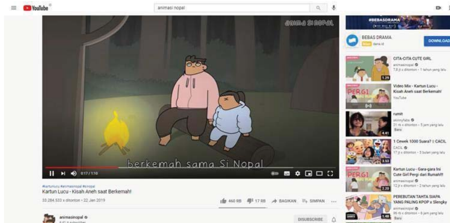
Gambar 1.4 Cuplikan video animasi Nopal viewers terbanyak kedua Gambar 2. Video ketiga pada tanggal 22 Maret 2019