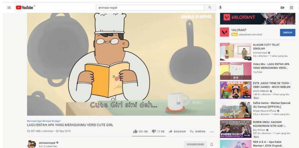
Gambar 1.6 Cuplikan video viewers terbanyak ke empat

Berikut peneliti akan memberikan data berupa tabel unggahan video episode Animasi Nopal yang ada di youtube. Tabel tersebut diteliti datanya pada setiap episodenya dari pertama diunggah tanggal 15 oktober 2018 hingga 28 Desember 2020