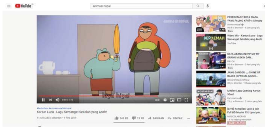
Gambar 1.3 cuplikan video animas Nopal viewers terbanyak

Video yang peneliti pilih pertama dengan viewers terbanyak diunggah pada 9 Februari 2019 dengan judul “Kartun Lucu – lagu Ssemangat sekolah yang Aneh!”.