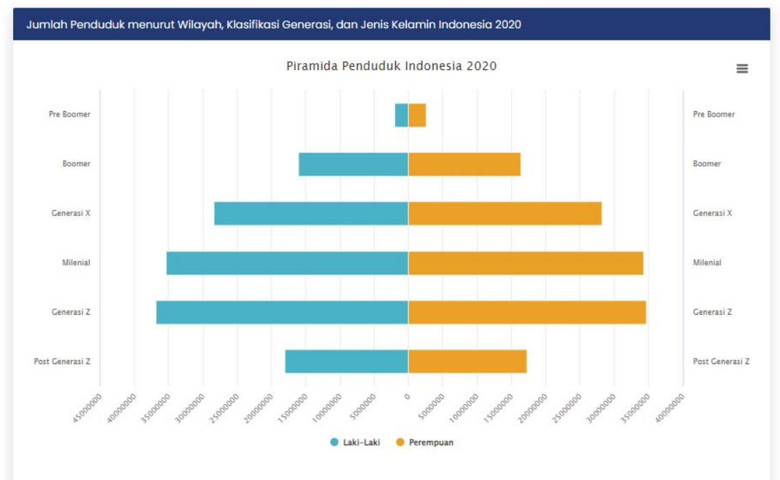
Gambar 1.1 (Pramida Penduduk Indonesia 2020)

terakhir, jika dibandingkan dengan hasil sensus penduduk pada tahun 2010, jumlah penduduk di Indonesia mengalami penambahan penduduk sebanyak 32,56 juta jiwa. Dari sensus penduduk 2020, komposisi penduduk di Indonesia dapat dibagi menurut generasinya. Hasil sensus menunjukkan bahwa saat ini penduduk di Indonesia terbagi dalam enam klarifikasi kelompok generasi, yang terdiri dari generasi Pre- Boomer, Generasi Bay Boomer, Generasi X, Generasi Y (Milenial), Generasi Z, Generasi Post-Z (Alpha) (Hary,2021:1). Sebelum membahas mengenai perbedaan bebrapa generasi tersebut, penulis lebh dulu menunjukkan piramida tentang penduduk Indonesia tahun 2020.