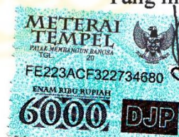
Resia Nory Fitriani