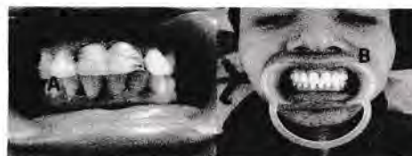
Gambar 6. Klinis sebelum dan sesudah perawatan

Satu minggu setelah semua prosedur perawatan selesai (insersi tetap restorasi akhir) pasien datang kontrol. Pada kondisi klinis didapatkan hasil restorasi yang bagus, adaptasi servikal yang rapat, dengan kesesuaian warna dan proporsi yang optimal. Subyektif pasien tidak ada keluhan dan pasien merasa puas dalam fungsi dan estetik hasil perawatan.