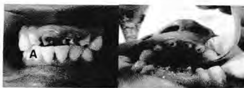
Gambar 4. Preparasi custom post