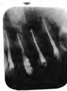
Gambar 3. Radiografi obturasi gigi #11, #12, #21, dan #22

Setelah preparasi saluran akar selesai dilakukan pengecekan tag bag dan pengeringan ruang saluran akar menggunakan paper point. Digunakan guttap point R-40 dan sealer (topseal) untuk obturasi gigi #12 dan #22. Gigi #11 dan #21, obturasi menggunakan teknik pengisian termoplastis dengan guttap R-50 sebagai mastercone dan dikombinasikan dengan backfill untuk pengisian \frac{2}{3} coronal ruang pulpa. Kemudian ditutup mahkota sementara dan pasien diintruksikan kontrol 1 minggu kemudian (gambar 3).