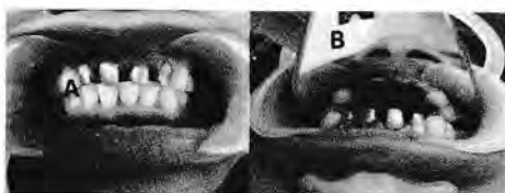
Gambar 5. Insersi custom post

Satu minggu kemudian pasien datang (kunjungan ke-4) dan dilakukan trial pasak tuang. Mahkota sementara dilepas, sisa semen sementara dibersihkan dan dilakukan trial pasak tuang dan dikoreksi menggunakan radiografi periapikal. Selanjutnya dilakukan insersi pasak tuang menggunakan GIC luting semen tipe 1 dan dilakukan pengurangan pasak tuang untuk penyesuaian inti restorasi akhir. Dilakukan pula enameloplasty pada insisal gigi #32 dan #41 untuk mendapatkan relasi yang harmonis dengan gigi anterior rahang atas.