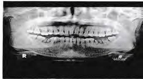
Gambar 2. Radiografi panoramik sebelum perawatan

Pada pemeriksaan radiografi panoramik, gigi #11 dan #21 terlihat patah bagian mahkota dan menunjukkan keterlibatan atap pulpa dengan radiolusensi kecil pada bagian apikal gigi #21. Terlihat gigi #36 dan #46 yang tinggal sisa akar dan gigi #37 karies profunda yang melibatkan atap pulpa (Gambar 2)