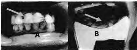
Gambar 1. Klinis gigi sebelum perawatan A. Tampak labial B. Tampak palatal

Pemeriksaan intra oral tampak gigi #11 dan #21 dengan restorasi akrilik menyatu untuk kedua gigi tersebut, tidak goyang, gingival kemerahan, dan perkusi tidak sakit serta non vital (Gambar 1). Gigi #12 dan #22 vital dan tidak ada kelainan labioversiserta sedikit rotasi. Gigi-gigi #32 dan #41 sedikit rotasi. Terdapat karang gigi pada seluruh giginya. Kondisi umum pasien baik.