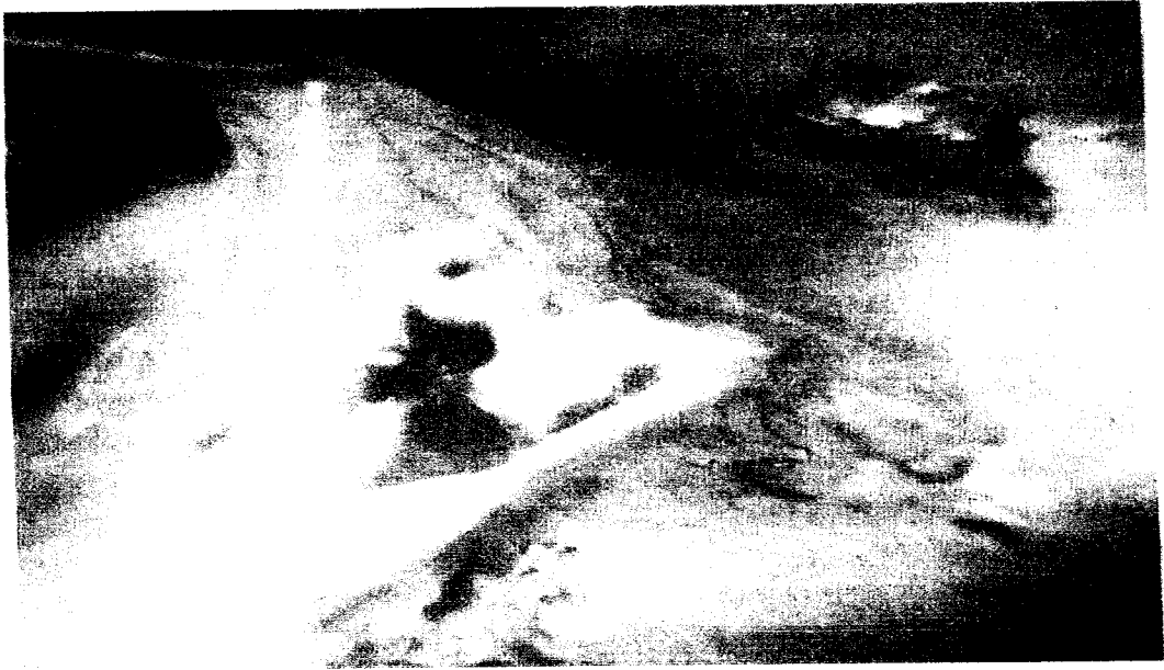
Gambar 3. Timbunan eksudat kaseus pada kantong udara