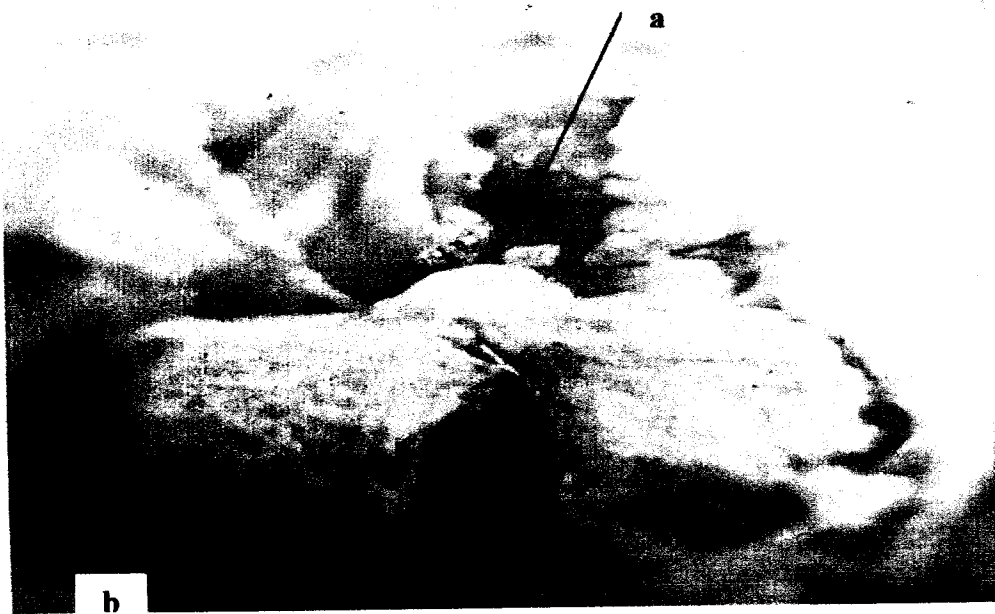
Gambar 4. (a) Perikarditis fibrinus dan (b) Perihepatitis akibat infeksi campuran Mycoplasma gallisepticum dan Escherichia coli