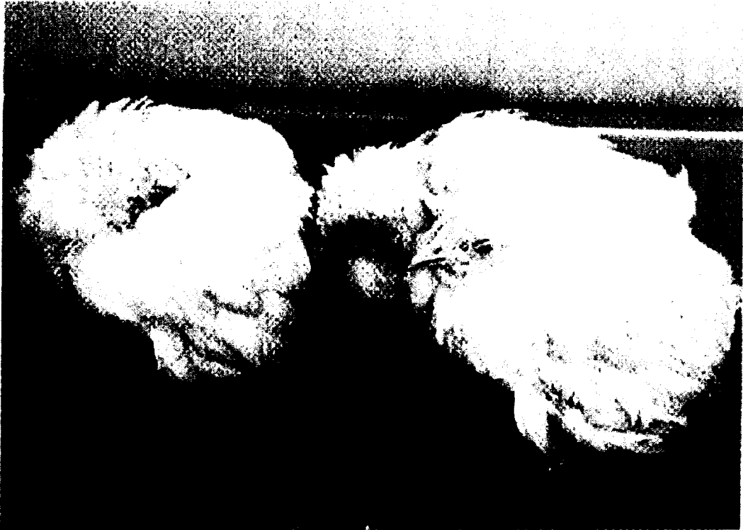
Gambar 5. Ayam berumur 4 hari yang terserang penyakit CRD