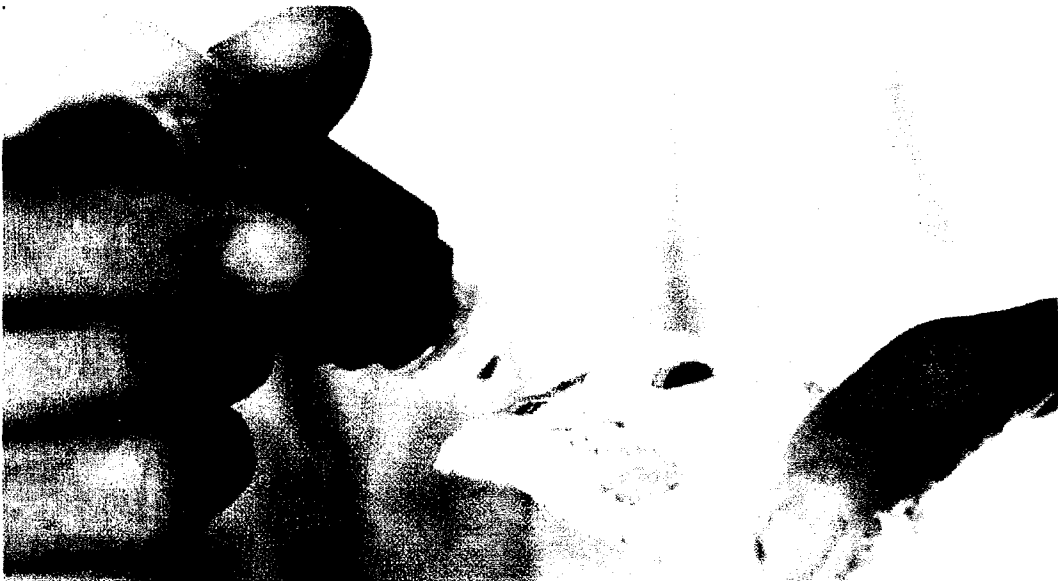
Gambar 1. Vaksin tetes pada hidung. Dilakukan dengan melakukan meneteskan vaksin ke kadalam hidung ayam.