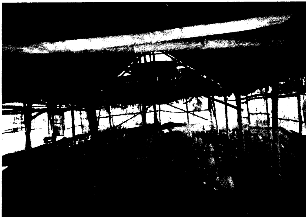
Gambar 6. Ayam pedaging umur 16 hari