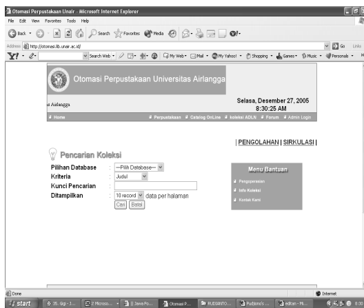
Gambar 3. Program Otomasi LARIS Perpustakaan Universitas Airlangga

Dengan adanya program ini maka kendala yang dihadapi oleh Perpustakaan Universitas Airlangga yaitu letak kampus A, B, dan C yang saling berjauhan dapat diatasi. Dengan demikian petugas bagian sirkulasi dapat mengetahui buku yang dipinjam oleh seorang mahasiswa, baik buku tersebut ada di lokasi kampus A, B, maupun C. Bagi pengguna bila sistem ini sudah dioperasikan akan dapat mengetahui status buku, apakah buku tersebut sedang dipinjam atau bisa dipinjam. Sedang absensi pegawai berfungsi untuk mengetahui waktu kehadiran dan pulang seorang pegawai, sehingga dapat dipantau.