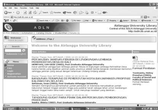
Gambar 2. ADLN Perpustakaan Universitas Airlangga

Setelah ADLN dapat diterapkan di Perpustakaan Universitas Airlangga, maka sejak tahun 2004 ADLN ini diperkenalkan ke ruang baca fakultas dan lembaga di lingkungan Universitas Airlangga. Dengan terhubungannya sistem ADLN di ruang baca fakultas dan lembaga di lingkungan Universitas Airlangga, diharapkan pengguna perpustakaan dapat mengakses informasi-informasi yang ada di ruang baca/lembaga maupun sebaliknya di perpustakaan.