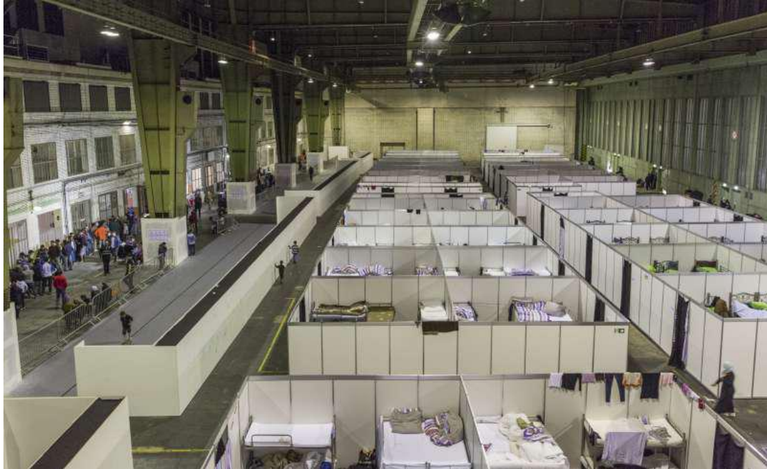
Gambar III. 1 Bandara Tempelhof untuk Tempat Penampungan Pengungsi