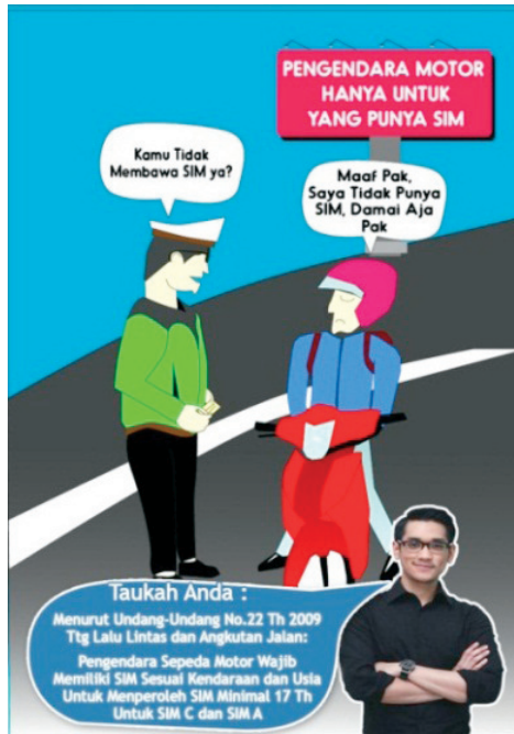
Gambar 1. Media Poster Tentang Keselamatan Berkendara