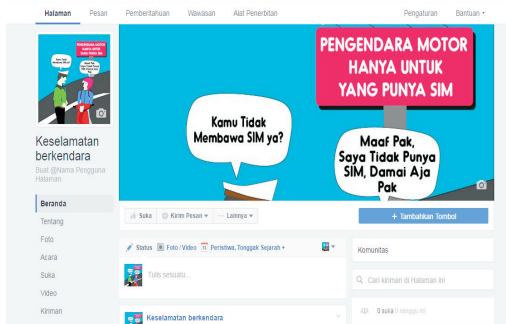
Gambar 2. Media Facebook Tentang Keselamatan Berkendara

coba dengan personal review kepada lima responden yang sebelumnya telah diberikan kuesioner.