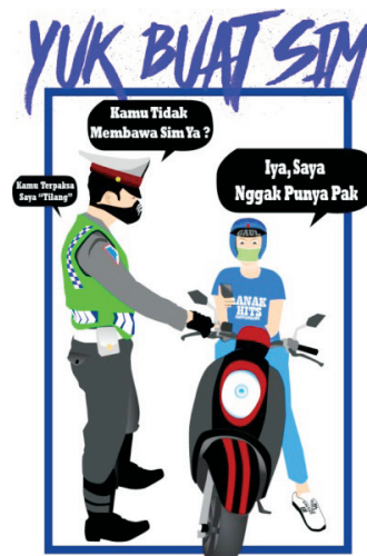
Gambar 3. Hasil Revisi Media Poster

Berikut ini adalah hasil dari revisi media yang dilakukan oleh peneliti: