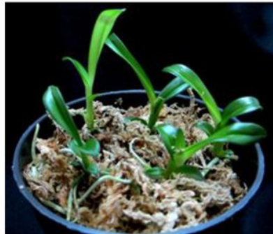
Gambar 3. Tanaman anggrek D. lasianthera 4 minggu setelah dipindah pada media sphagnum.

14 Plantlet (Gambar 2D) selanjutnya dikeluarkan dari botol dan dicuci dengan air mengalir untuk melepaskan media yang masih menempel pada plantlet dan selanjutnya dikeringkan di atas koran. Plantlet ditanam pada pot menggunakan media sphagnum dan di aklimatisasi di dalam rumah kaca. Tingkat hidup D. lasianthera lebih dari 85% (Gambar 3).