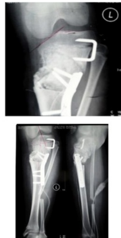
Gambar 4. Post Operasi Pasien 2