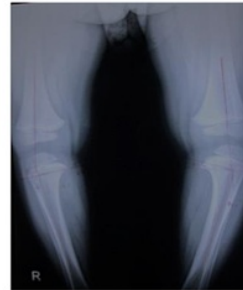
Gambar 21 Radiologis Post Terapi Kasus 3

Pasien dilakukan terapi konservatif dengan diet dan observasi. Dengan hasil adanya perbaikan MD angle kanan 10 derajat, MD angle kiri 11 derajat,