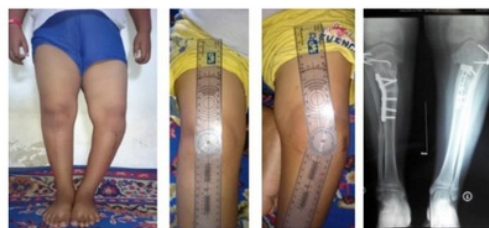
Gambar 2. Kondisi Post-Operasi Pasien