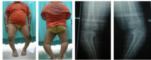
Gambar 1. Kondisi Pre Operatif

kiri. Dan dilanjutkan dengan pemberian knee brace hingga usia 18 tahun.