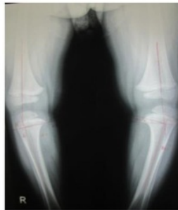
Gambar 6 Radiologis Preoperatif Kasus

Pada pemeriksaan radiologis didapatkan MD angle kanan 10 derajat, MD angle kiri 14 derajat, dengan sloping medial epiphysis, beaking pada metafisis kedua tibia bagian proksimal dan penebalan korteks medial.