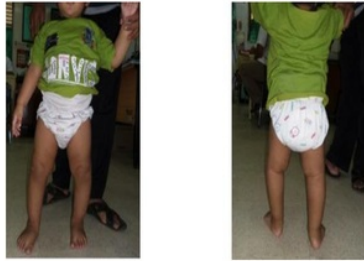
Gambar 5 Preoperatif Kasus 3

derajat, genu varum sinistra 14 derajat, dengan range of motion dalam batas normal.