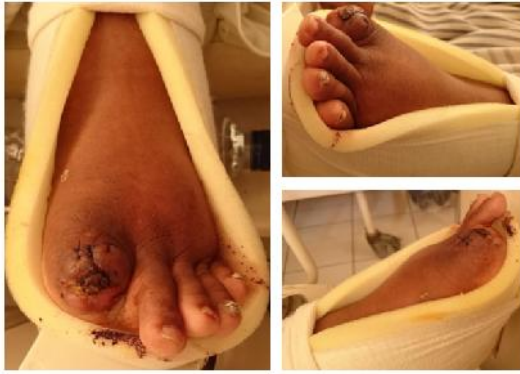
Gambar 3. Gambaran klinis Squamous Cell Carcinoma pedis yang telah diamputasi

Pemeriksaan FNAB (4 Juni 2015) di RSUD Dr. Soetomo ditemukan sampel biopsi dari kaki kiri metastasis SCC poorly differentiated.