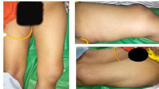
Gambar 1. Gambaran klinis paha kiri

Benjolan pada jempol kiri sejak 2 tahun. Benjolan semakin lama membesar dan bernanah. Pasien tidak memiliki riwayat Diabetes Mellitus sebelumnya. Jempol kiri tersebut kemudian diamputasi atas permintaan pasien. Luka post amputasi tidak pernah mengering. Pasien dilakukan pemeriksaan x-ray dan pengambilan sampel jaringan pada jempol kaki kiri tersebut.