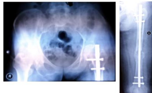
Gambar 5. Gambaran radiologis post operatif

Berdasarkan hasil skoring maka dilakukan tatalaksana pada pasien menggunakan immobilisasi dengan Skin Traction dan ORIF Elektif Pro Interlocking Nail Femur Sinistra.