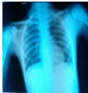
Gambar 2. Foto Toraks Pasien dalam Batas Normal

Kondisi pasien pada saat akan dilakukan induksi anestesi adalah: jalan napas bebas dengan