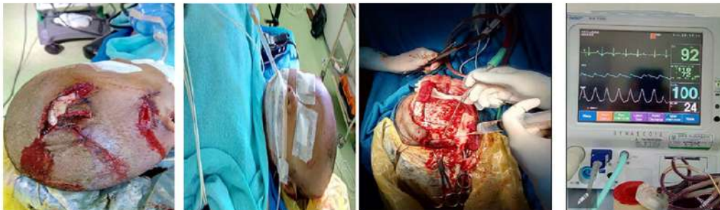
Gambar 5. Jalannya Anestesi dan Pembedahan

Pascabedah pasien diobservasi di Ruang Observasi Intensif (ROI) dengan kondisi jalan