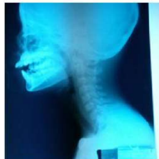
Gambar 3. Foto Cervical Lateral Pasien dalam batas normal