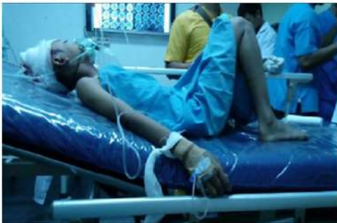
Gambar 1. Posisi head up diberlakukan pada Pasien untuk membantu Drainase Vena Cerebral

Pada survei sekunder didapatkan GCS E2V2M5 dengan pupil bulat isokor 3 mm mata kanan dan kiri serta refleks cahaya positif. Terdapat jejas dan luka robek berdarah pada regio temporo parietal kanan serta edema pada mata kanan dan kiri. Selain itu pasien dengan jalan napas bebas tanpa tanda distress napas dengan suara napas vesikuler kanan dan kiri tanpa suara napas tambahan. Dengan O 2 masker 6 lpm terbaca pulse oximetry 99%. Tekanan darah 111/60 dan MAP 70 mmHg, nadi 123 kali per menit, dengan perfusi hangat kering pucat. Produksi urine 40 mL/jam, warna kuning jernih. Temuan survei sekunder lainnya dalam batas normal.