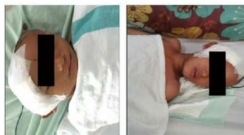
Gambar 7. Kondisi Pasien Pasca Ekstubasi

Pasien ini adalah anak-anak usia 12 tahun dengan