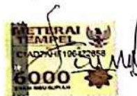
(Fariz Aryo Baskoro)