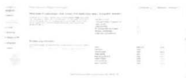
Gambar 2.6 Pemeriksaan Pra- Pemasangan

Begitu pula dengan bagian Lisensi pada Gambar 2.7 dilewati dan langsung menuju ke bagian berikutnya.