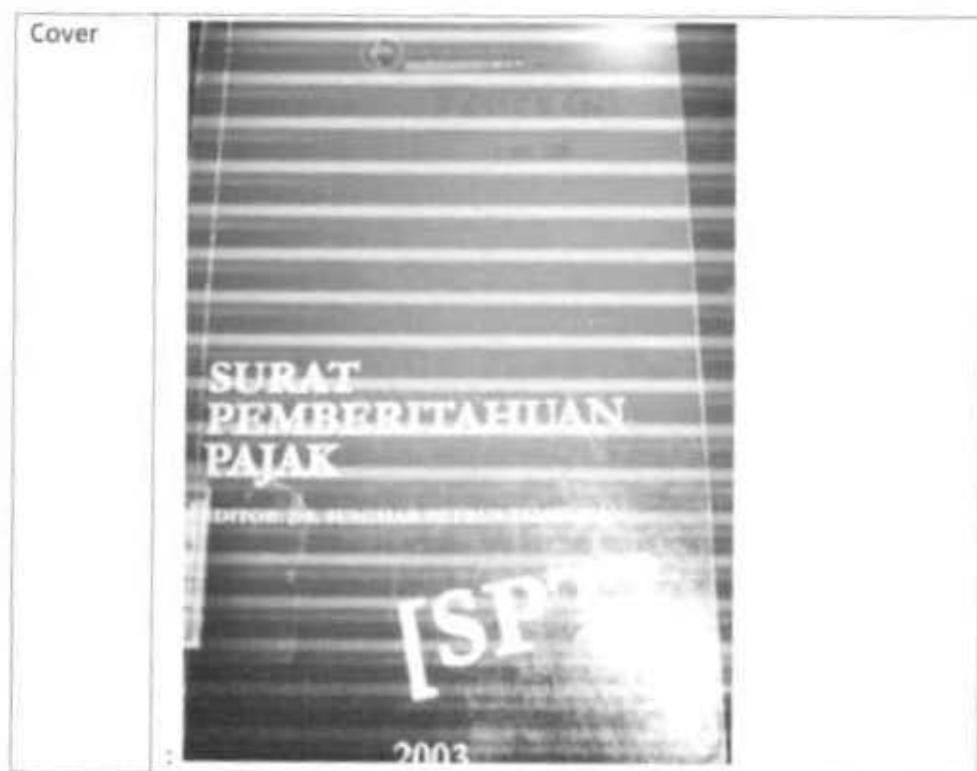
Gambar 2.36 Format Penulisan Deskripsi Data Buku

Pada gambar diatas terdapat 13 keterangan deskripsi, untuk cover buku nantinya akan diatur pada saat entri data pada web. Selanjutnya membuka Web Joomla yang telah dibuat untuk langsung memasukkan data. Langkahnya pilih Login → Content → Article Manager → Copy Paste Deskripsi Buku (tetxbook) → atur judul → section → category → Jika ada gambar klik Image pada pojok kiri bawah → save .