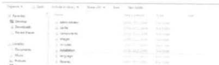
Gambar 2.12 Folder Installation pada perangkat Instalasi Joomla