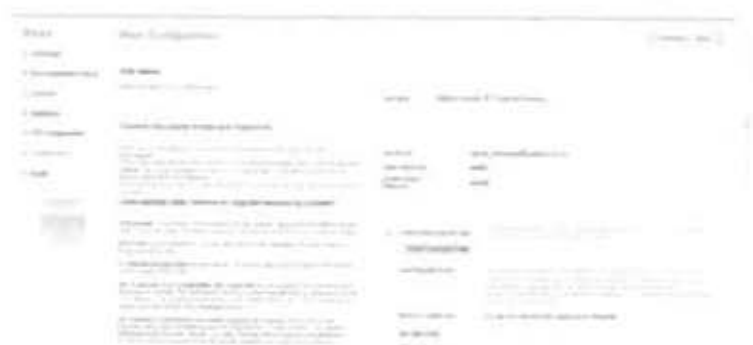
Gambar 2.10 Main Configuration

Jika sudah diklik Instal Sampel Data maka hasilnya ada pada tampilan Gambar 2.11 Dibawah ini. Tampilan ini merupakan tahap terakhir dalam proses instalasi Joomla. Setelah itu klik pilihan untuk melanjutkan.