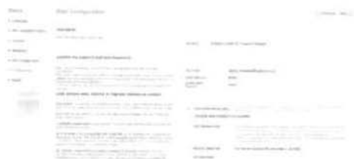
Gambar 2.11 Tampilan Kelengkapan Pengisian Main Configuration

Jika sudah diklik Instal Sampel Data maka hasilnya ada pada tampilan Gambar 2.11 Dibawah ini. Tampilan ini merupakan tahap terakhir dalam proses instalasi Joomla. Setelah itu klik pilihan untuk melanjutkan.