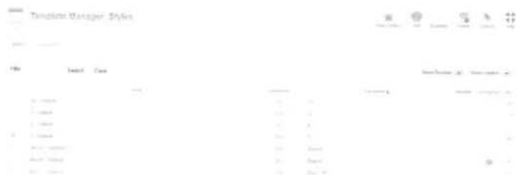
Gambar 2.21 Pemilihan Tempalte yang sudah di unduh

Setelah memasuki menu template manager pilih template yang sudah diunduh, untuk melihatnya bisa dengan menyorot nama template akan ditampilkan bagaimana visual template tersebut serta centang template yang dipilih. Gambar 2.21 perhatikan tanda bintang kuning yang ada pada menu template manager dengan nama default klik bintang tersebut hingga bintang berpindah pada tempalte yang dipilih. Setelah selaesai melakukan pengaturan diatas pilih tombol view site untuk melihat tampilan FrontEnd yang sudah diatur seperti pada gambar 2.22 di bawah ini.