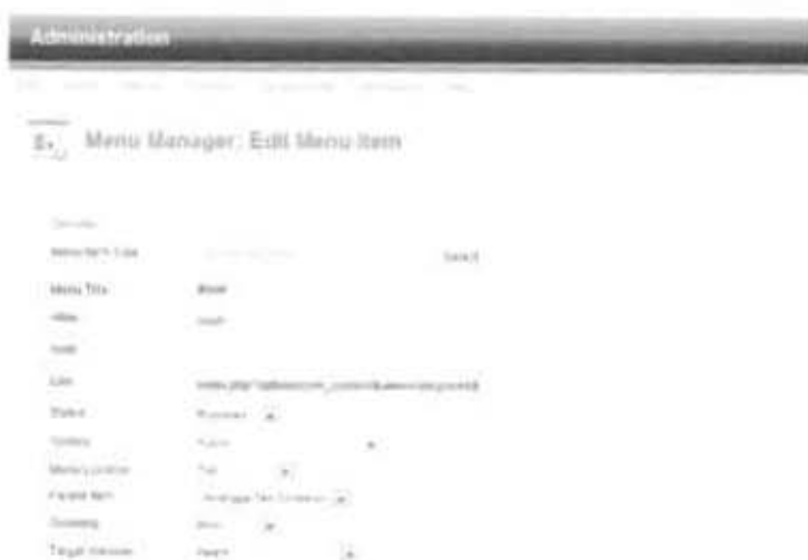
Gambar 2.28 Mengisi Formulir Pembuatan Menu Top