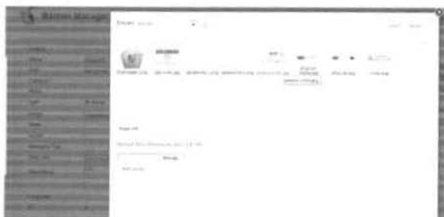
Gambar 2.33 Tampilan pengaturan Banner saat Upload Gambar

Setelah pengaturan tersebut selesai maka tampilan keseluruhan pengaturan yang telah dilakukan akan tampil pada Gambar 2. 38 sampai gambar 2.40 dibawah ini.