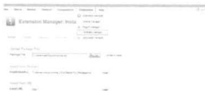
Gambar 2.20 Informasi Template yang sukses di instal dan pilih menu Template Manager

Lalu masuk pada menu Template Manager untuk mengatur tempale yang sudah kita unduh. Pada gambar 2.20 terlihat ada peringatan instal tempalte yang sukses lalu kita tinggal memilih template yang sudah kita instal.