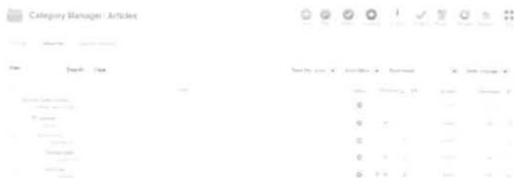
Gambar 2.24 Category Manager

mempunyai 3 kategori yang merupakan 3 kategori dalam Subjek Taxation (Perpajakan) . Langkah membuat kategori adalah dengan memilih menu Category Manager .