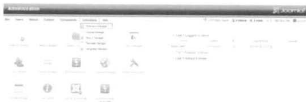
Gambar 2.16 Menu Extension untuk instal templat Joomla

Setelah memilih menu Install/Uninstall maka akan muncul tampilan pada Gambar 2.17 dibawah ini. Klik tombol Browse untuk memilih templat yang sesuai dengan Produk Subject Guide