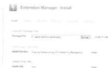
Gambar 2.19 Upload File Tempalte

Pada gambar diatas merupakan langkah untuk memilih file tempalte yang telah diunduh untuk ditempatkan pada web Joomla sebagai Produk Subject Guide Of Taxation .Setelah selesai memilih klik open lalu upload seperti yang tergambar pada Gambar 2.19 di bawah ini.