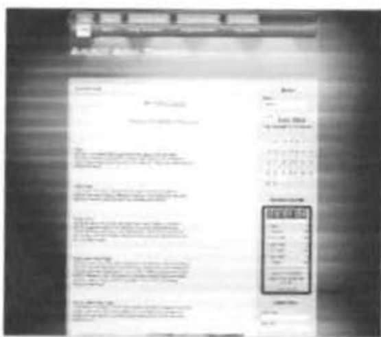
Gambar 2.23 Tampilan FrontEnd web Subject Guide Taxation

Hasil pengaturan templat diatas dapat dilihat dari gambar 2.23 dibawah ini. Setelah melakukan pengaturan tampilan FrontEnd web masih belum sempurna, masih perlu mengatur menu- menu did alam web Joomla untuk nantinya dapat mengelompokkan data yang akan dimasukkan pada web Subject Guide Taxation ini.