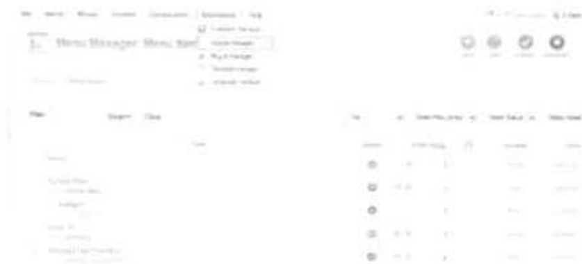
Gambar 2.31 Membuat Modul

gratis pada http://www.joomla.extension.com . Tampilan menuju menu Modul dapat dilihat pada gambar dibawah ini.