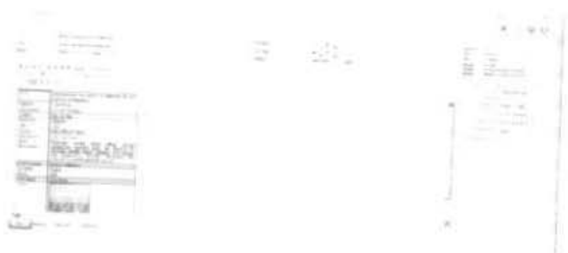
Gambar 2.41 Tampilan Entri Data Untuk Memasukkan Website