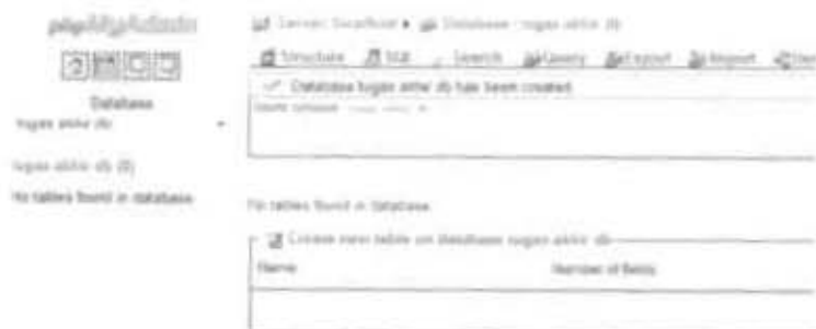
Gambar 2.3 Database yang telah selesai di buat

Tuliskan nama database yang ingin dibuat lalu klik tombol create , maka akan terbentuk database dengan nama tugas akhir seperti gambar di bawah ini :