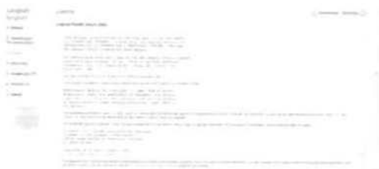
Gambar 2.7 Pengaturan Lisensi

Begitu pula dengan bagian Lisensi pada Gambar 2.7 dilewati dan langsung menuju ke bagian berikutnya.