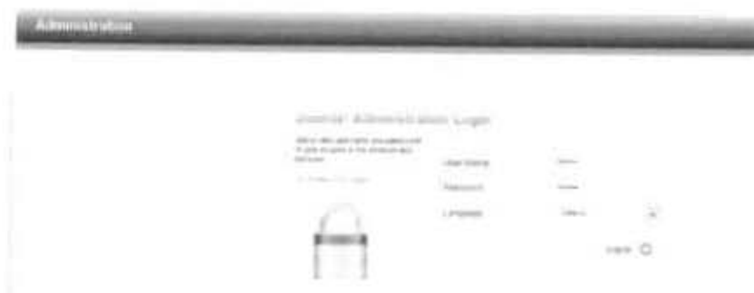
Gambar 2.13 Tampilan Login Administrator

Setelah menghapus folder Installation pada perangkat Joomla maka selanjutnya langsung memasuki administrator dengan memasuki login pada Gambar 2.13 dengan username admin, dan password yang sudah kita masukkan saat pengaturan Main Configuration .