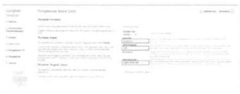
Gambar 2.8 Pengaturan Basis Data atau Database

Setelah mengatur database untuk pemasangan web, selanjutnya FTP Configuration tidak perlu dilakukan pengaturan, dan langsung menuju ke pengaturan berikutnya.