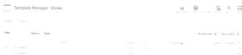
Gambar 2.22 Pilih tombol view site

Setelah memasuki menu template manager pilih template yang sudah diunduh, untuk melihatnya bisa dengan menyorot nama template akan ditampilkan bagaimana visual template tersebut serta centang template yang dipilih. Gambar 2.21 perhatikan tanda bintang kuning yang ada pada menu template manager dengan nama default klik bintang tersebut hingga bintang berpindah pada tempalte yang dipilih. Setelah selaesai melakukan pengaturan diatas pilih tombol view site untuk melihat tampilan FrontEnd yang sudah diatur seperti pada gambar 2.22 di bawah ini.