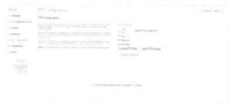
Gambar 2.9. Pengaturan FTP Configuration

Setelah mengatur database untuk pemasangan web, selanjutnya FTP Configuration tidak perlu dilakukan pengaturan, dan langsung menuju ke pengaturan berikutnya.