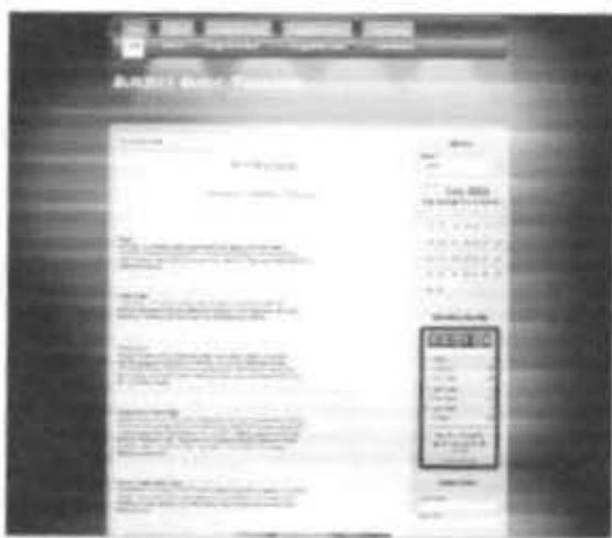
Gambar 2.30 Tampilan FrontEnd Subject Guide Taxation Website

Hasil yang akan terlihat pada tampilan FrontEnd halaman web Joomla yang digunakan untuk menampilkan Produk Subject Guide Taxation adalah sebagai berikut :