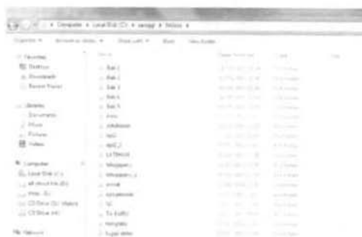
Gambar 2.4 Letak Folder Joomla dengan nama tugas akhir di folder htdocs

Setelah database selesai dibuat Kemudian instalasi Joomla 1.5 Stable dengan cara ekstrak ke dalam folder dengan nama tugas akhir dan copy folder tersebut ke dalam direktori dimana folder xampp terinstal yaitu di komputer C:\xampp\htdocs seperti pada gambar 3 dibawah ini.