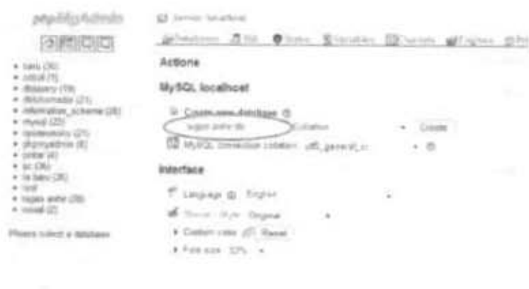
Gambar 2.2 Pembuatan database pada PHPMyAdmin

Klik tombol admin pada pada MySQL, untuk langsung menuju ke PHPMyAdmin untuk membuat database yang nantinya digunakan sebagai pangkalan data dari web Joomla yang akan dibuat sebagai penyajian produk "Subject Guide". Pada PHPMyAdmin kita membuat database baru tanpa melakukan pengaturan lebih lanjut.