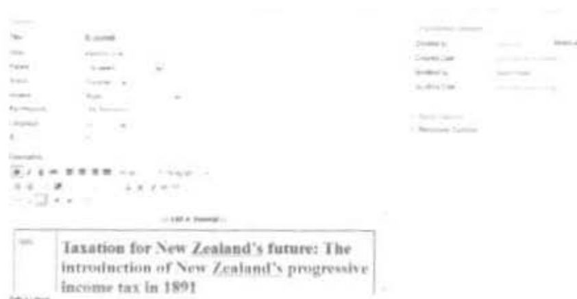
Gambar 2.38 Tampilan entry data E- Journal pada Web