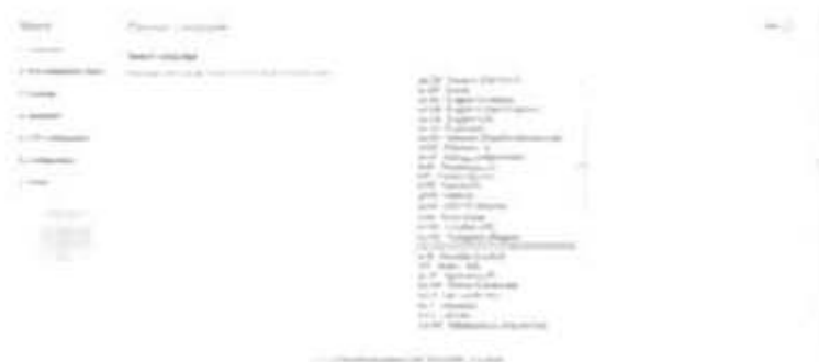
Gambar 2.5 Pemilihan Bahasa

Selain meletakkan stable joomla 2.5 pada folder htdocs xampp juga diletakkan template joomla sebagai tampilan interface dari joomla. Selanjutnya buka Mozilla Firefox dan ketikkan http://localhost/tugas akhir . Setelah semua perangkat joomla telah disiapkan maka selanjutnya joomla siap dibangun didalam localhost komputer.