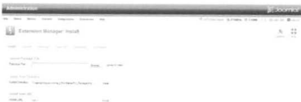
Gambar 2.17 Unduh dan Instal Template

Setelah memilih menu Install/Uninstall maka akan muncul tampilan pada Gambar 2.17 dibawah ini. Klik tombol Browse untuk memilih templat yang sesuai dengan Produk Subject Guide