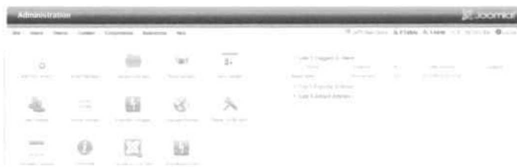
Gambar 2.14 Tampilan Back End Joomla