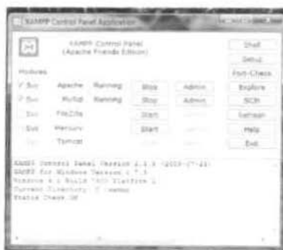
Gambar 2.1 Aktifasi Web Server Xampp

Klik tombol admin pada pada MySQL, untuk langsung menuju ke PHPMyAdmin untuk membuat database yang nantinya digunakan sebagai pangkalan data dari web Joomla yang akan dibuat sebagai penyajian produk "Subject Guide". Pada PHPMyAdmin kita membuat database baru tanpa melakukan pengaturan lebih lanjut.