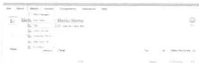
Gambar 2.27 Membuat Menu Top

pilih induk Parent yang akan dijadikan sebagai Induk dari sub menu yang akan dibuat.