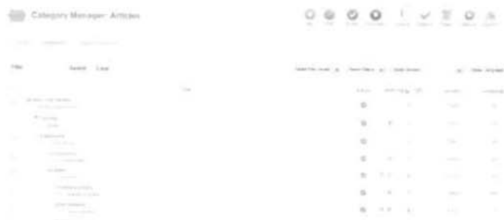
Gambar 2.26 Hasil Pembuatan Kategori

seperti pada panduan Pengelompokan data adalah pada gambar 2.29 berikut :