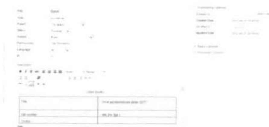
Gambar 2.37 Tampilan Entri Data E-Book pada Web

menyimpan pdf dari e-book. E-Book dan E-Journal diambil dari data web e-book dan e-journal simpan halaman webnya dan address . Seperti pada entri data koleksi textbook pada koleksi e-book dan e-journal data yang ada dalam folder dialihkan pada entri artikel pada web, lalu insert gambar. Tampilan entri data pada web adalah sebagai berikut :