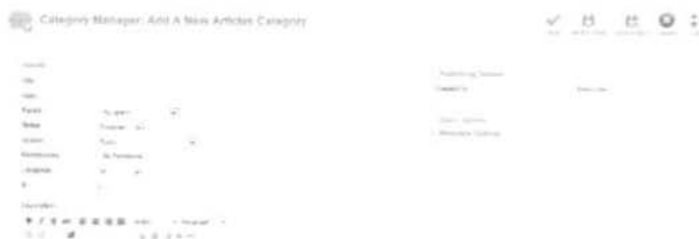
Gambar 2.25 Formulir Pembuatan Kategori baru

Pada gambar 2.27 terdapat kategori standar bawaan dari Joomla!, untuk membuat kategori maka pilih menu new setelah itu akan muncul formulir pengisian atau pembuatan category yang baru.