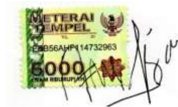
Imelda Syamsi Arfianti