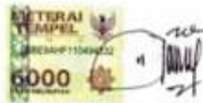
(Nurul Lailatul Khusna)