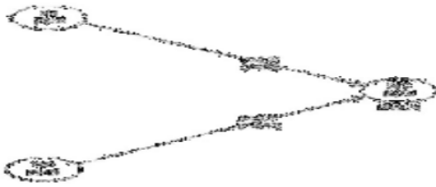
Gambar 3. Pengaruh langsung x terhadap y

Hipotesis dalam penelitian ini dapat disimpulkan, setelah dibuktikan pengaruh langsung kecerdasan emosional dan perceived organization support terhadap resistance to change . Berikut hasilnya: