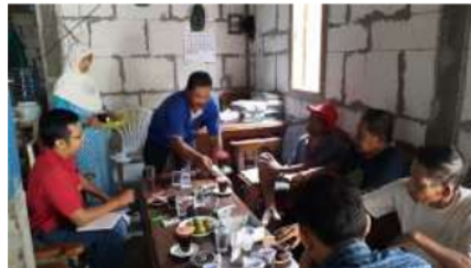
Gambar 3. Kegiatan Sosialisasi Pendirian Bank Sampah