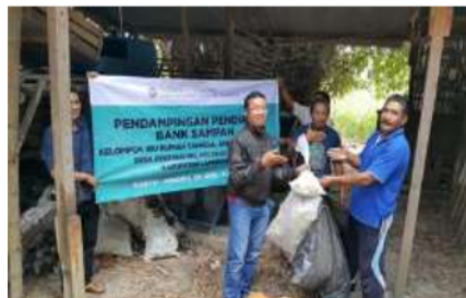
Gambar 4. Kegiatan Sosialisasi Pendirian Bank Sampah