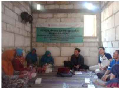
Gambar 8. Kegiatan Pendampingan Ketiga Bank Sampah

4. Kegiatan pendampingan yang ketiga dilakukan pada tanggal 14 Oktober 2018 oleh salah satu tim inisiator kelompok kerja bank sampah. Secara histori, adapun agenda pendampingan bank sampah yang telah dilaksanakan di antaranya, pendampingan pertama telah dilalui dengan penyuluhan pentingnya pengelolaan sampah di lingkungan masyarakat. Pendampingan kedua dilalui dengan pembentukan dan peresmian kelompok kerja bank sampah. Perlu menjadi catatan, bahwa setiap tahap pendampingan akan selalu menjadi evaluasi baik kami sebagai inisiator maupun anggota bank sampah untuk pengembangan kelompok kerja bank sampah agar lebih maju kedepannya