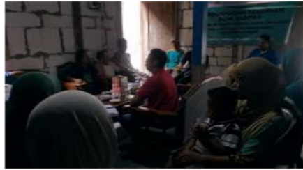
Gambar 5. Kegiatan Sosialisasi Pendirian Bank Sampah

2. Setelah proses sosialisasi dilakukan oleh pihak mitra, kegiatan kedua yang dilakukan pada pendampingan tersebut adalah juga dibentuk kelembagaan beserta kelompok-kelompok untuk mengelola sampah di tingkat rumah tangga. Kelembagaan yang dibentuk memiliki struktur yang sederhana, yang beranggotakan ketua, sekretaris, dan bendahara. Jumlah kelompok yang disepakati adalah 10-15 kelompok, di mana masing-masing kelompok beranggotakan maksimal 5 orang. Pada struktur organisasi tersebut, tugas dari masing-masing pengurus adalah sebagai berikut: