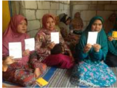
Gambar 9. Sosialisasi Sistem Pencatatan Bank Sampah

dikarenakan selama program kerja ini berjalan masih tidak ada sistim pencatatan perolehan sampah yang komprehensif, maka pada hari ini tim inisiator juga berkesempatan memberikan kepada setiap anggota kelompok kerja bank sampah buku catatan sampah sebagai media pencatatan yang komprehensif dan berkelanjutan. Dan berkesempatan mensosialisasikan sistim pencatatan sampah ke dalam buku catatan sampah tersebut. Sehingga hasil perolehan sampah setiap anggota dapat dihitung secara pasti karena imbal hasil atau manfaat ekonomi yang akan dibagikan kepada anggota dihitung berdasarkan pada jumlah sampah yang dikumpulkan.