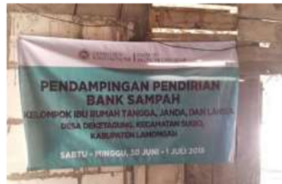
Gambar 2. Spanduk Kegiatan Pendampingan Pendirian Bank Sampah

Sosialisasi ini dilakukan selama 2 hari, yaitu pada tanggal 30 Juni 2018 hingga 01 Juli 2018 di salah satu rumah warga desa Deketagung. Sosialisasi ini dihadiri oleh sekitar 30 warga yang terdiri oleh kepala dusun, ketua program green and clean dan ketua Rt 003 dan Rt 005 dusun dekat agung, desa dekat agung kabupaten Lamongan.