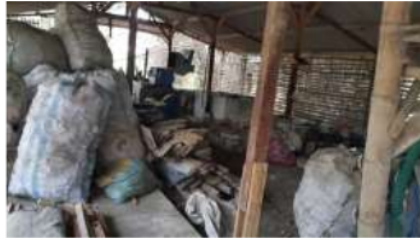
Gambar 7. Tempat Pengumpulan Sampah

Kelompok kecil tersebutlah yang akan berperan dalam pemilahan sampah sebelum disetorkan ke bank sampah. Sesuai yang disepakati oleh warga dan pihak mitra, sampah dipilah menjadi 3 jenis, yaitu: (1) sampah plastik; (2) sampah organik; dan (3) sampah kertas. Sebagai tambahan, pada tahapan ini juga telah disepakati tempat pengumpulan sampah, yakni di belakang rumah kepala Dusun.