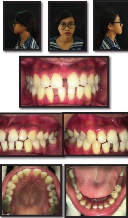
Gambar 2. pemeriksaan ekstra oral dan intra oral.

Pada Fase I dilakukan Dental Health Education , scaling dan root planing dan desensitasi 26,27,32,33,34,35. Pada Fase II maka dilakukan terapi frenektomi labial dan depigmentasi 13,12,11,21,22,23. Fase III dilakukan restorasi gigi 15,16,46. Pro protesa gigi 36 dan fase IV maintenance phase dan orthodontik.