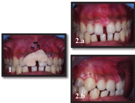
Gambar 4. Kontrol 7 hari post Frenektomi labialis

Pasien datang untuk kontrol 7 hari post frenektomi. Pasien hanya merasakan nyeri pada hari pertama dan tidak ada keluhan perdarahan, jahitan dan periodontal pack masih ada (Gambar 4.1). Lalu dilakukan angkat jahitan, irigasi larutan saline dan aplikasi hyaluronic acid 0,2 % (Gambar 4.2).