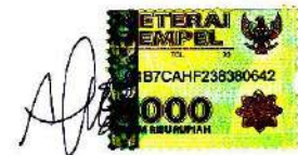
Anggun Nurul Izzati