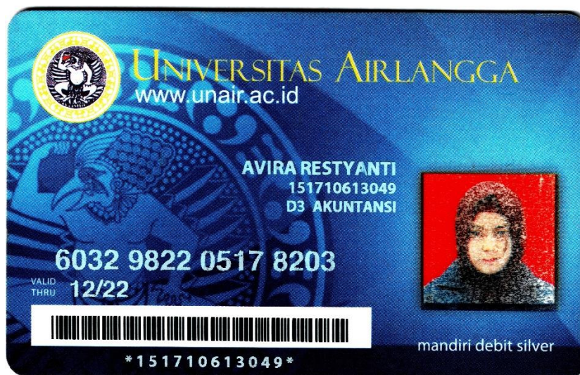
Kartu Tanda Mahasiswa Bagian Depan