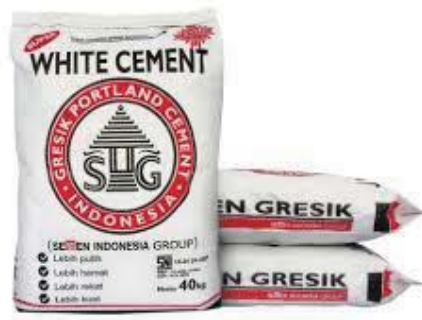
Gambar 2.8 Super White Cement