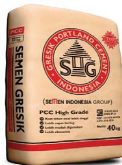
Gambar 2.6 Semen PCC